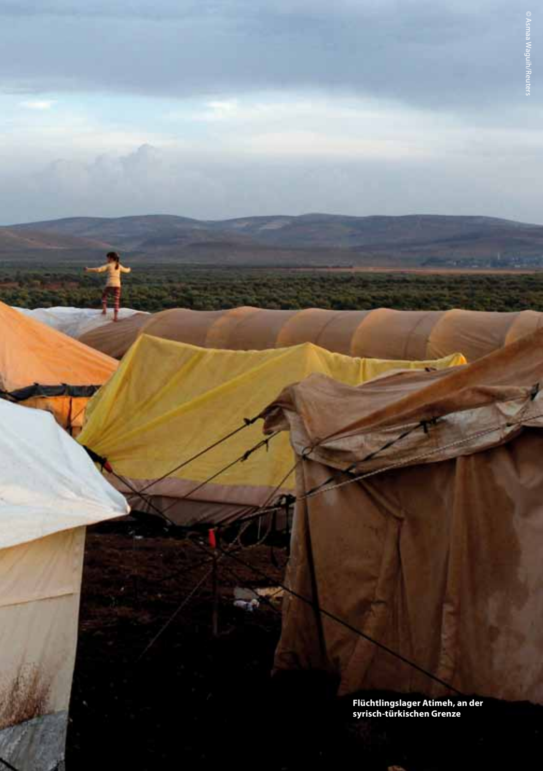
Flüchtlingslager Atimeh, an der syrisch-türkischen Grenze