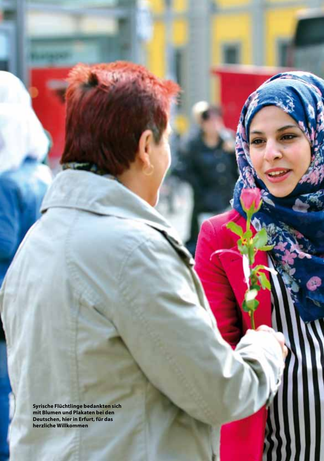
Syrische Flüchtlinge bedankten sich mit Blumen und Plakaten bei den Deutschen, hier in Erfurt, für das herzliche Willkommen