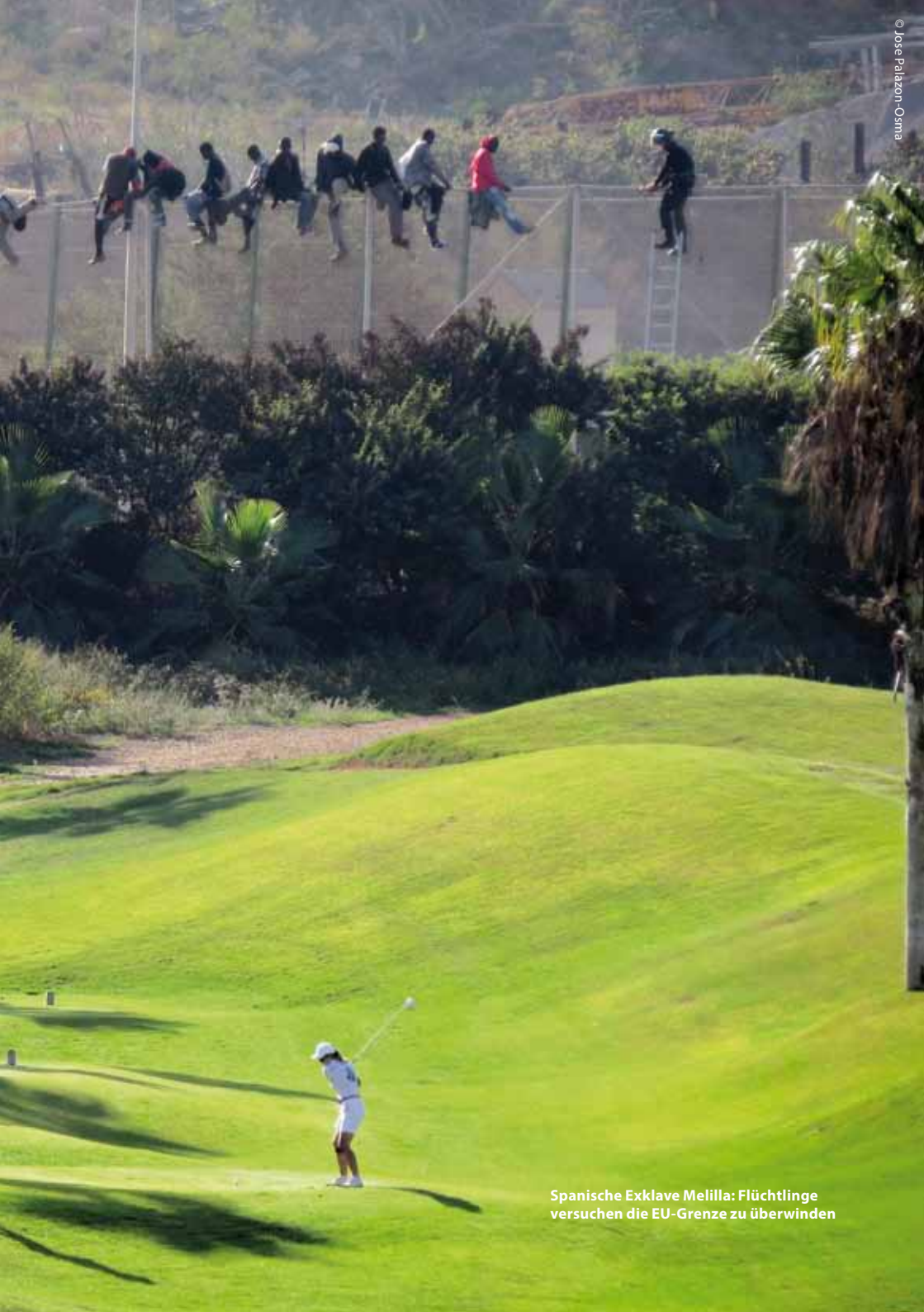
Spanische Exklave Melilla: Flüchtlinge versuchen die EU-Grenze zu überwinden