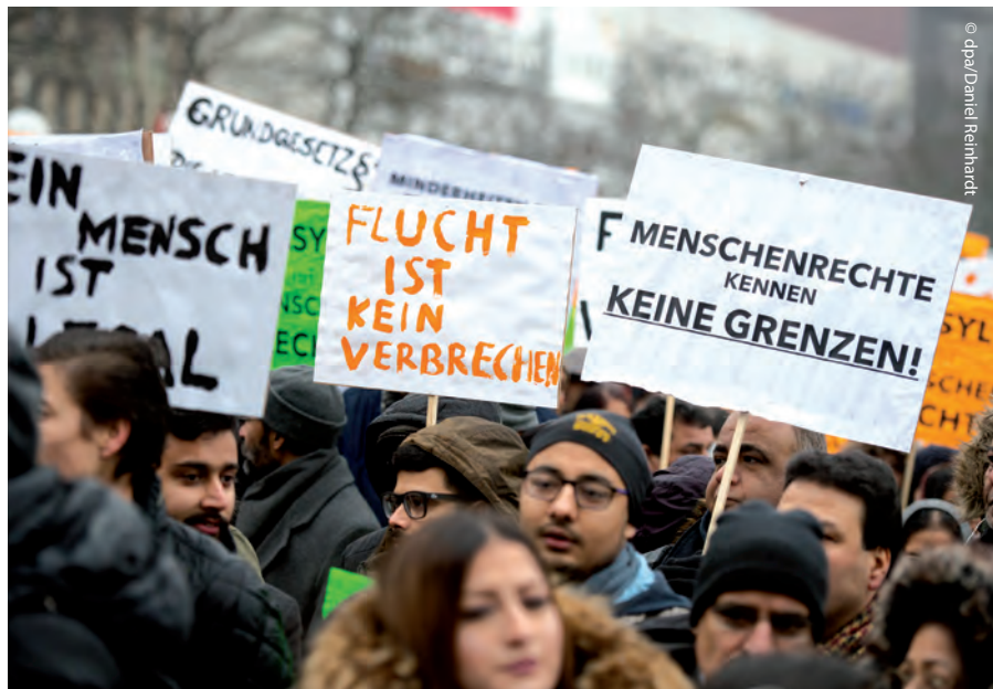
Januar 2017: Demonstration gegen Abschiebungen nach Afghanistan.

PRO ASYL kämpft gegen diese Entwicklung an. Es geht um die Menschenrechte, die Schutzbedürfnisse und die