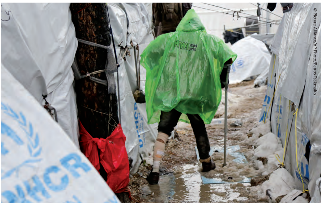
EU-Hotspot Moria auf Lesbos: Die Lebensumstände für die Schutzsuchenden sind unerträglich.