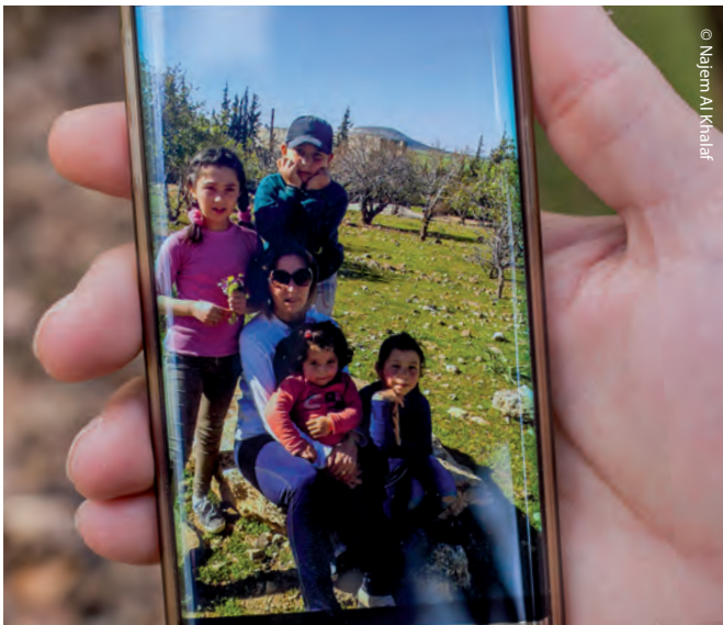
Familien gehören zusammen! Flüchtlinge dürfen nicht über Jahre von ihren Angehörigen getrennt werden.

Die besondere Schutzwürdigkeit von Ehe und Familie ist im Grundgesetz verankert. Und die Regierungspartei der Kanzlerin formuliert feierlich: „Wir stehen für eine wertorientierte Politik, in der Familie und Ehe die Grundpfeiler unserer freien und solidarischen Gesellschaft bilden.“ Davon ist gegenwärtig nur noch wenig übrig.