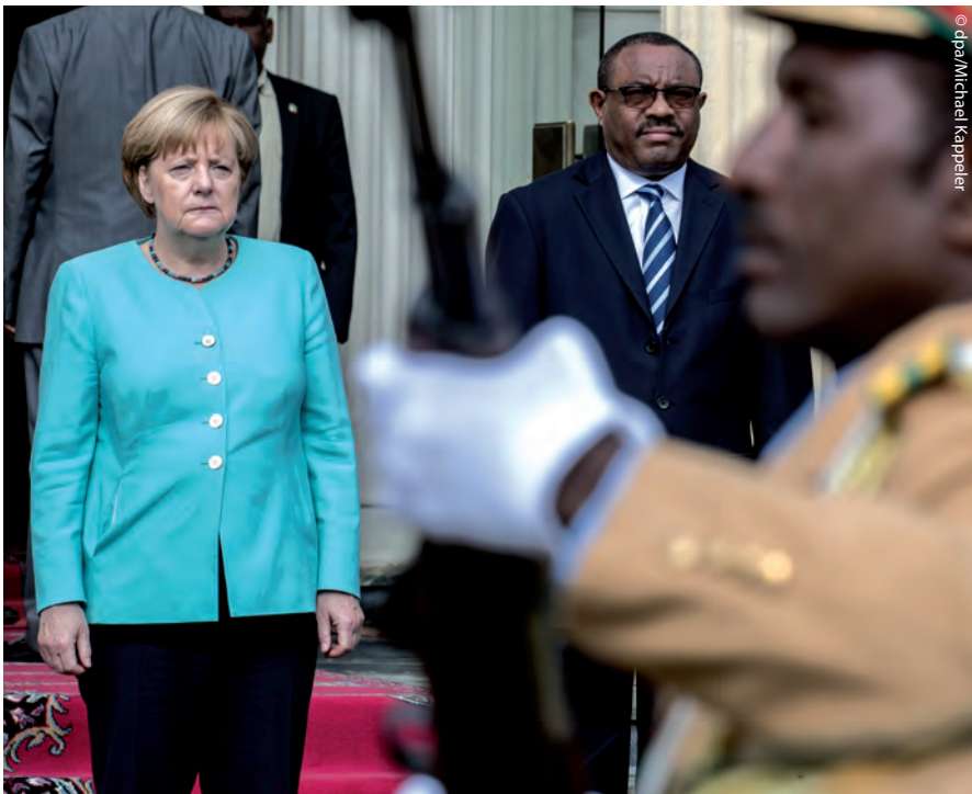
Zusammenarbeit mit autoritären Regimes zur „Migrationskontrolle“: Angela Merkel bei ihrem Besuch in Äthiopien im Oktober 2016.

Vor Europas Grenzen tobt der Krieg in Syrien mit unerbittlicher Härte, die Lage in Afghanistan ist unsicherer als je zuvor. Die Diktatur in Eritrea, die Terrormilizen in Somalia sowie die katastrophale Menschenrechtssituation in vielen anderen Ländern und Regionen treiben die Schutzsuchenden über das Mittelmeer.