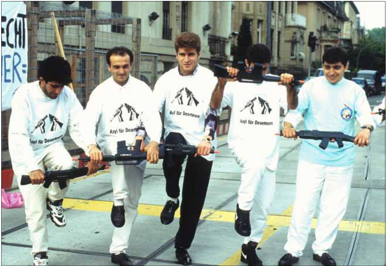
Kriegsdienstverweigerer aus der Türkei in Frankfurt/M.

Diese weite Definition setzt sich fort in der Resolution