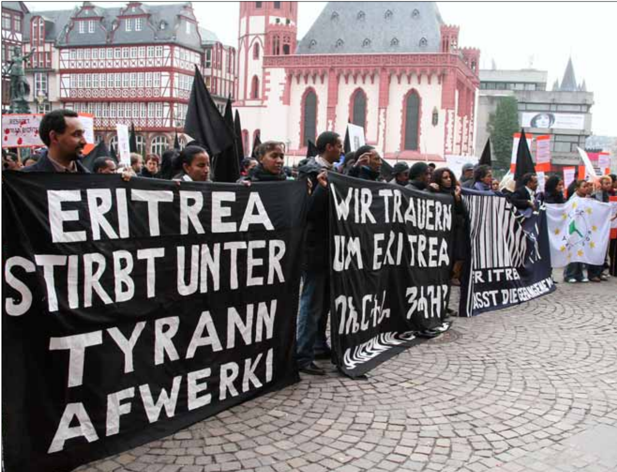
Demonstration in Frankfurt/M. 2009

einen als Landesverrat und zum anderen als eine regimfeindliche Einstellung gesehen.“ 7 In einer früheren Entscheidung hatte das Verwaltungsgericht Frankfurt im Falle eines eritreischen Deserteurs ausgeführt: „Der Kläger hat sofort im Anschluss an seine Zurück-