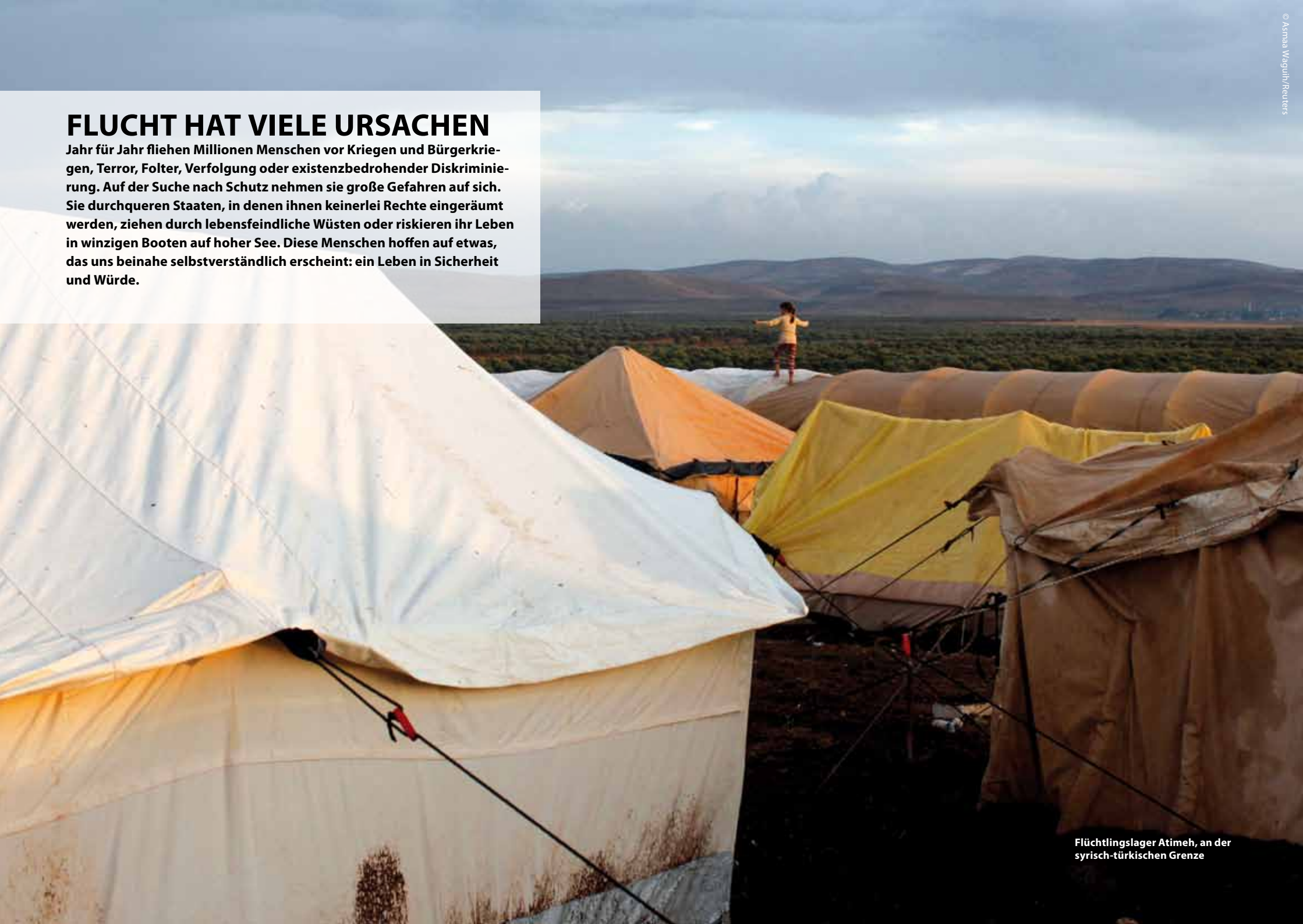
Flüchtlingslager Atimeh, an der syrisch-türkischen Grenze

Jahr für Jahr fliehen Millionen Menschen vor Kriegen und Bürgerkriegen, Terror, Folter, Verfolgung oder existenzbedrohender Diskriminierung. Auf der Suche nach Schutz nehmen sie große Gefahren auf sich. Sie durchqueren Staaten, in denen ihnen keinerlei Rechte eingeräumt werden, ziehen durch lebensfeindliche Wüsten oder riskieren ihr Leben in winzigen Booten auf hoher See. Diese Menschen hoffen auf etwas, das uns beinahe selbstverständlich erscheint: ein Leben in Sicherheit und Würde.