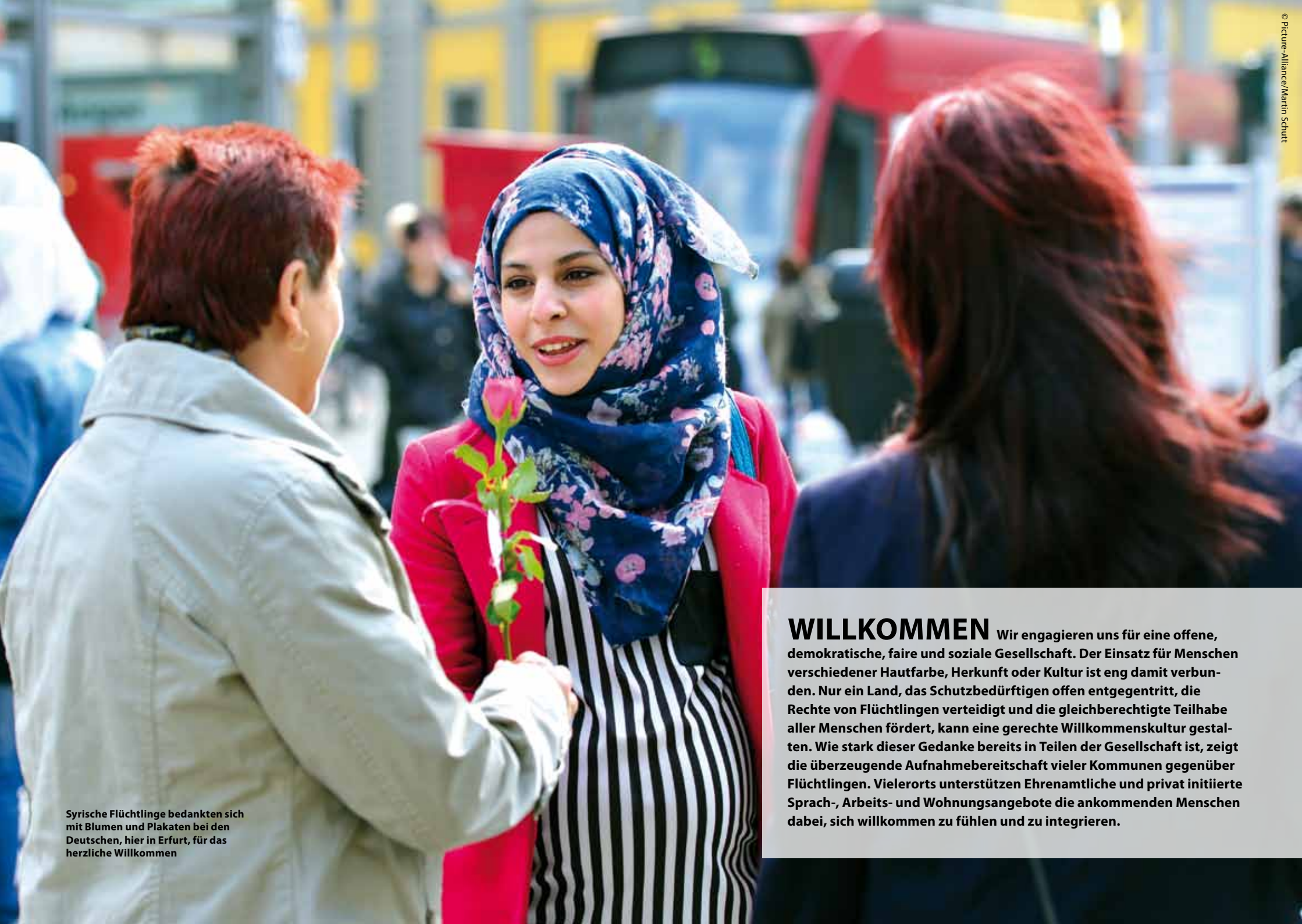
Syrische Flüchtlinge bedankten sich mit Blumen und Plakaten bei den Deutschen, hier in Erfurt, für das herzliche Willkommen

WILLKOMMEN Wir engagieren uns für eine offene, demokratische, faire und soziale Gesellschaft. Der Einsatz für Menschen verschiedener Hautfarbe, Herkunft oder Kultur ist eng damit verbunden. Nur ein Land, das Schutzbedürftigen offen entgegentritt, die Rechte von Flüchtlingen verteidigt und die gleichberechtigte Teilhabe aller Menschen fördert, kann eine gerechte Willkommenskultur gestalten. Wie stark dieser Gedanke bereits in Teilen der Gesellschaft ist, zeigt die überzeugende Aufnahmebereitschaft vieler Kommunen gegenüber Flüchtlingen. Vielerorts unterstützen Ehrenamtliche und privat initiierte Sprach-, Arbeits- und Wohnungsangebote die ankommenden Menschen dabei, sich willkommen zu fühlen und zu integrieren.