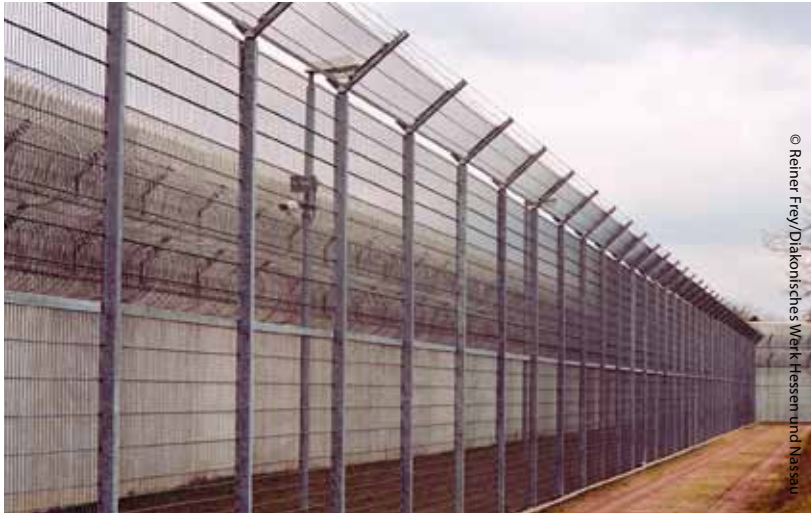
Abschiebungshaft in Ingelheim