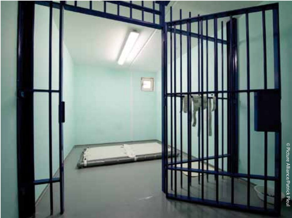
Besonders gesicherter Haftraum Eisenhüttenstadt