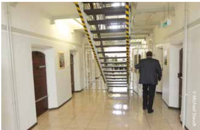
Ein Alltag zwischen Langeweile und Überwachung Bilder aus der Abschiebungshaft in Rendsburg