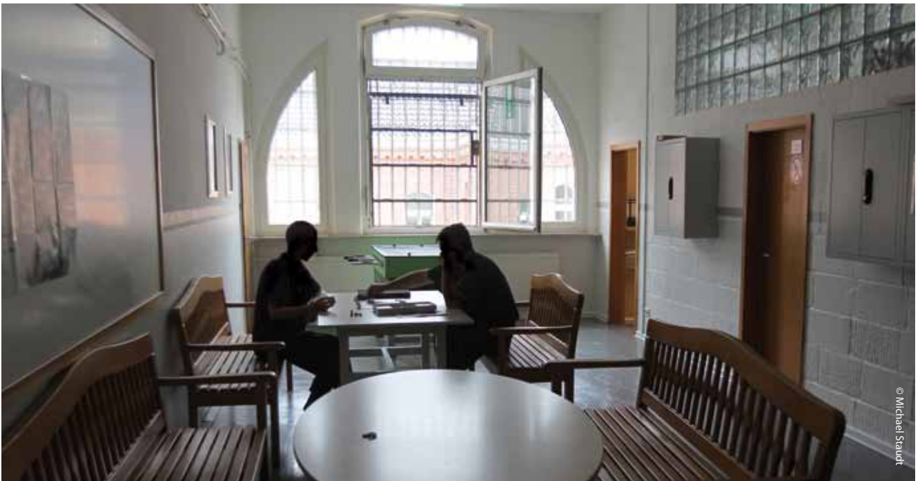
Gemeinschaftsraum in der Abschiebungshaft Rendsburg

Familientrennung: Wenn Familien/Eheleute durch die Bundespolizei aufgegriffen werden, erfolgt regelmäßig die Trennung, d.h. der Mann wird in Dresden untergebracht, die Frau in der Regel in Eisenhüttenstadt, weniger in Chemnitz. Aus der JVA Dresden dürfen die Männer dann 8 Minuten telefonieren, danach bricht oft der Kontakt ab. Neben der getrennten Unterbringung besteht das Problem, dass die Ehepaare dann auch ggf. getrennt zurückgeschoben werden können. Siehe auch Situation Eisenhüttenstadt.