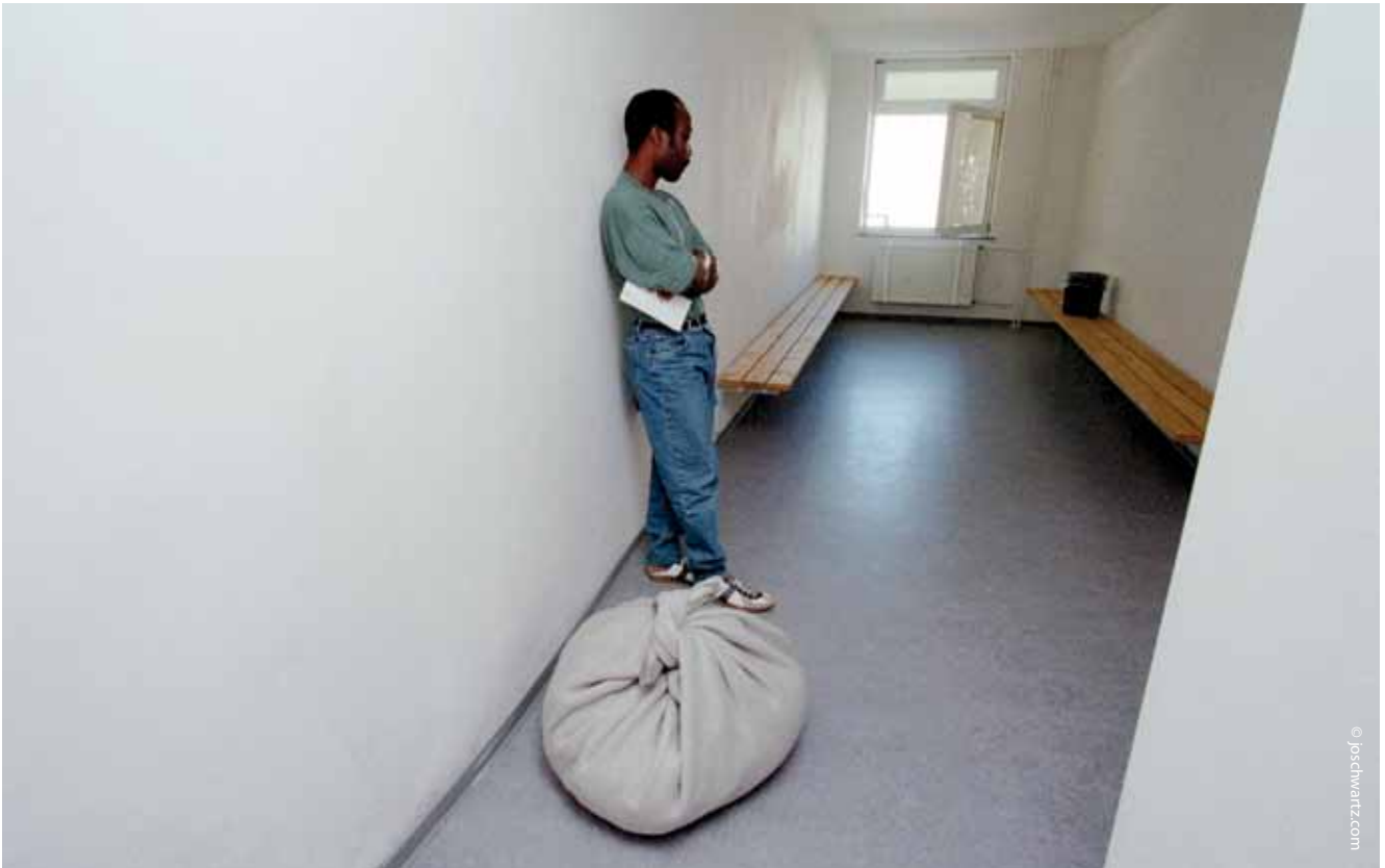
JVA Büren: Ein Häftling wartet mit gepackten Habseligkeiten und Abschiebepapieren auf den Transport zum Flughafen.