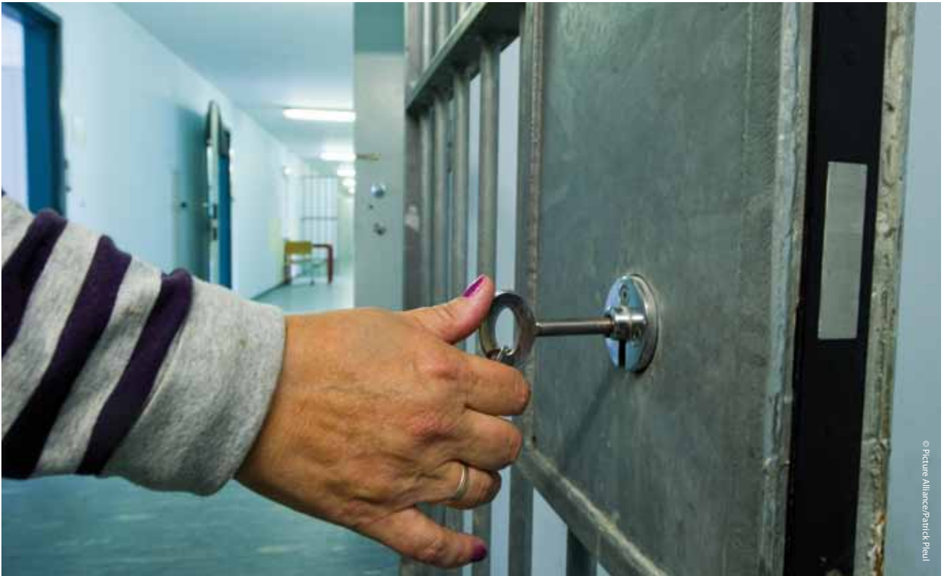
Abschiebehaftanstalt der Ausländerbehörde Brandenburg in Eisenhüttenstadt