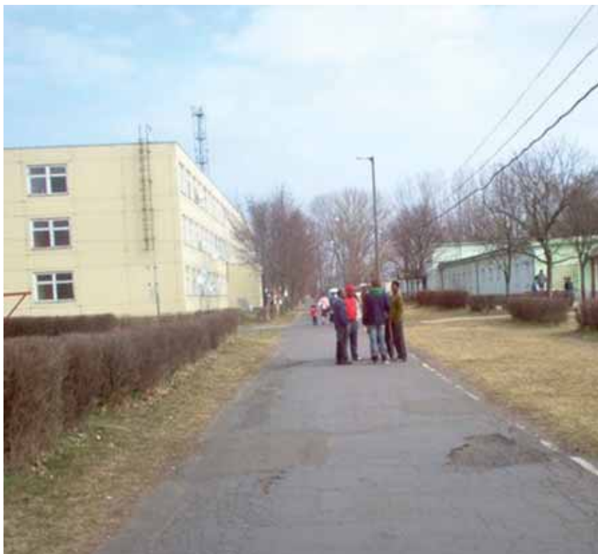
↑ GESPRÄCHE IM FLÜCHTLINGSLAGER DEBRECEN

Die beschlossenen Gesetzesänderungen haben die bereits bestehenden Härten für Asylbewerber und Flüchtlinge weiter verschärft. Nicht erst seit der veränderten Rechtslage versucht ein großer Teil der Flüchtlinge nach der Registrierung als Asylsuchende Ungarn wieder zu verlas-