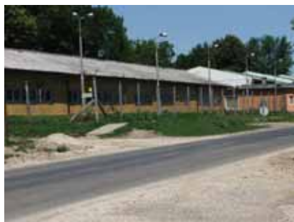
↑ PRE-INTEGRATIONSLAGER FÜR FLÜCHTLINGE IN BICSKE