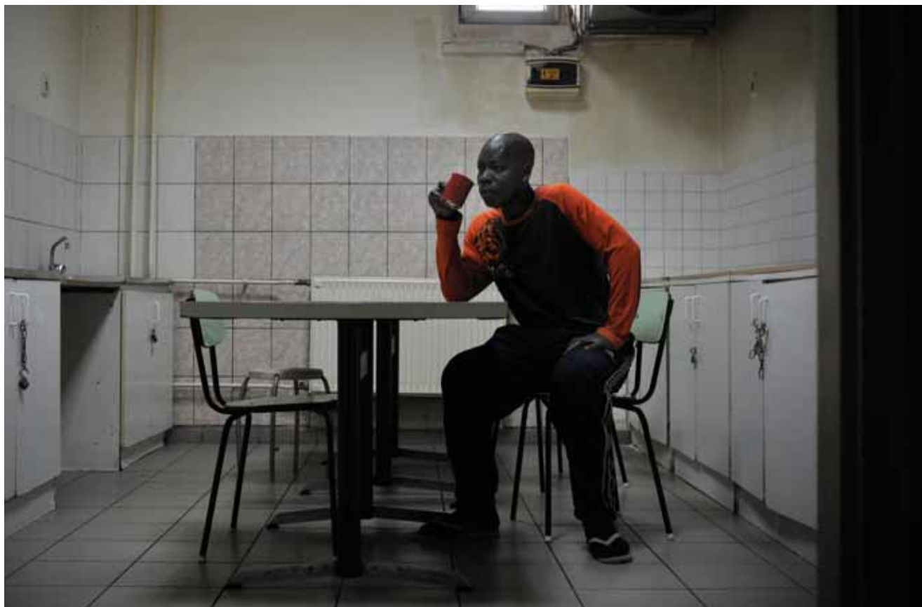
↑ OBDACHLOSER SUDANESE IN EINEM OBDACHLOSENHEIM IN BUDAPEST