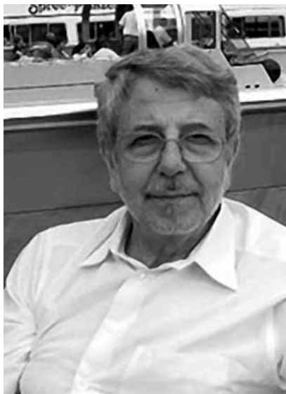
↑ FERENC KÖSZEG

Geboren 1939 in Budapest, überlebte Ferenc Köszeg den Nationalsozialismus als kleiner Junge unter falschem Namen in einem Budapester Nonnenkloster. Während der ungarischen Revolution 1956 verteilte er Flugblätter, wurde festgenommen und inhaftiert. Von 1963 bis 1980 arbeitete Ferenc Köszeg als Redakteur zweier Literaturverlage. Als er 1986 anlässlich des 30. Jahrestages der Niederschlagung des ungarischen Aufstandes eine Stellungnahme von ungarischen, tschechischen, slowakischen, polnischen und ostdeutschen Dissidenten mitverfasste, wurde sein Reisepass konfisziert. Erst nach seinem Hungerstreik wurde er ihm zwei Jahre später wieder ausgehändigt. Er gründete das European Roma Rights Center und das ungarische Helsinki-Komitee mit, war Mitinitiator des Unabhängigen Rechtsberatungsdienstes in Ungarn (Independent Legal Aid Service), des „Fonds für die Armen“ und verschiedener anderer Institutionen. 1990 bis 1998 war er Abgeordneter im ungarischen Parlament. Ferenc Köszeg hat zusammen mit Mitstreiterinnen und Mitstreitern zahlreiche Menschenrechtsverletzungen und die katastrophalen Verhältnisse in den Flüchtlings- und Haftlagern an der Grenze Ungarns in der Ukraine an die Öffentlichkeit gebracht. Die Stiftung PRO ASYL ehrte ihn dafür 2006 mit dem Menschenrechtspreis.