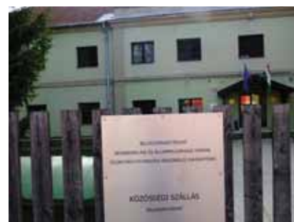
↑ ABSCHIEBELAGER IN BALLASAGYARMAT

Der Versuch, in einem anderen EU-Mitgliedstaat Schutz und menschenwürdige Lebensbedingungen zu finden, ist jedoch in vielen Fällen gescheitert. Viele derjenigen, die es versucht haben, wurden relativ bald nach ihrer Weiterflucht wieder nach Ungarn zurückgeschoben. Dies geschieht im Falle von Asylsuchenden oder abgelehnten Antragstellern auf Grundlage der Dublin II-Verordnung und im Falle von anerkannten Flüchtlingen aufgrund entsprechender Rückübernahmeabkommen. 23 Zahlreiche Flüchtlinge, die für diesen Bericht ihre Situation geschildert haben, wurden bereits mehrmals aus anderen europäischen Ländern nach Ungarn abgeschoben.