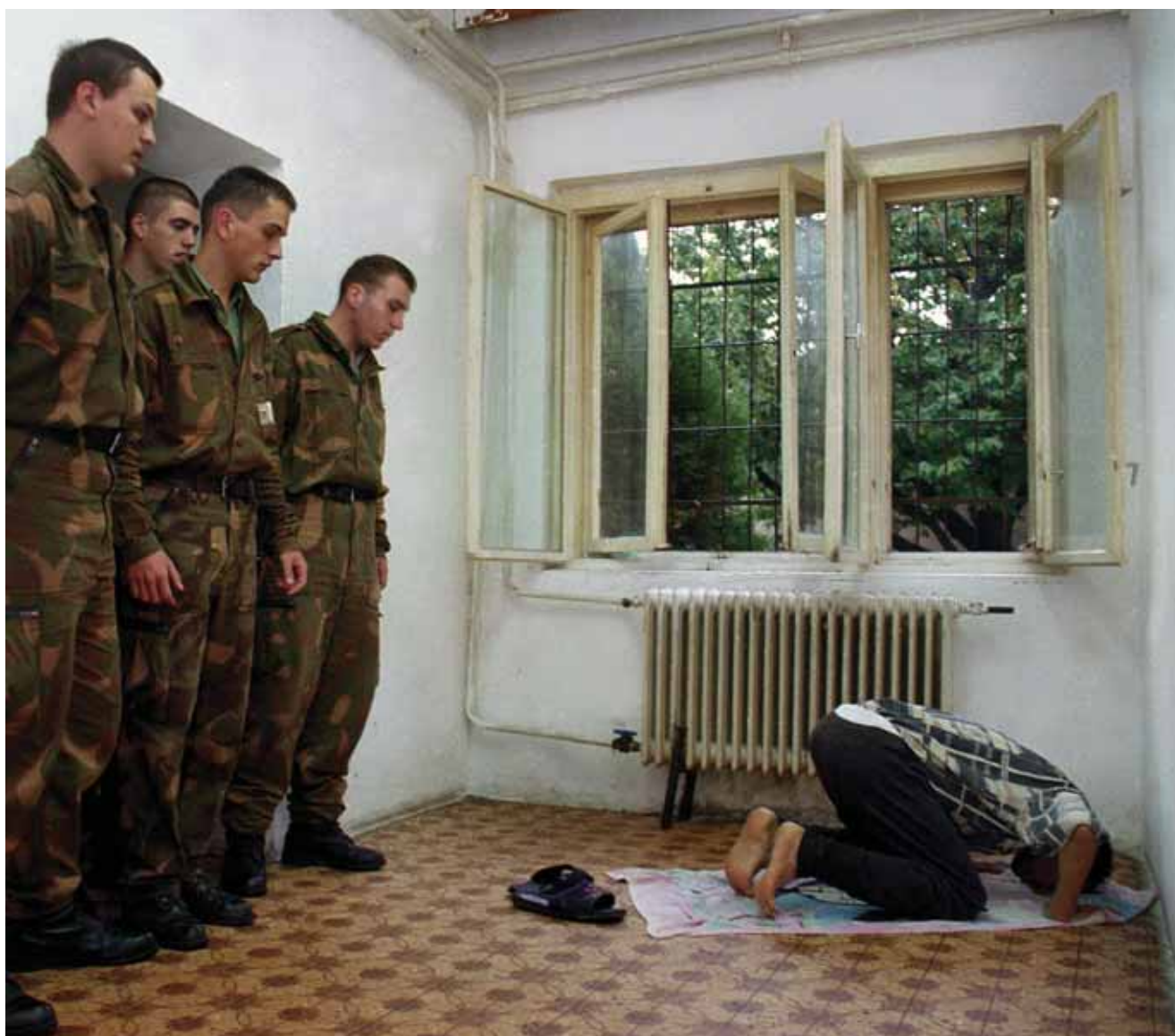
↑ HAFTLAGER IN GYÖR

vor, in welchem sehr detailliert auf die Haftbedingungen in diesen temporären Hafteinrichtungen für Flüchtlinge eingegangen wird.