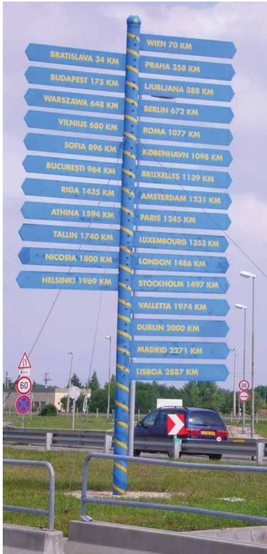
↑ DIE MEISTEN FLÜCHTLINGE FLIEHEN AUS UNGARN WEITER IN ANDERE EUROPÄISCHE LÄNDER.

Manche der Flüchtlinge, die wir in Ungarn getroffen haben, hatten wir bereits zuvor kennengelernt: in Griechenland oder der Ukraine auf ihrem Weg in die europäischen Länder in denen sie sich Schutz und einen sicheren Ort zum Bleiben erhoffen. Über das Border Monitoring Project Ukraine (BMPU) 13 bestehen bereits seit über drei Jahren Kontakte auch nach Ungarn. In Griechenland fährt seit Sommer 2010 ein Infomobil 14 regelmäßig die Orte an, die für Schutzsuchende auf ihrer Weiterflucht nach Europa von Bedeutung sind. Aus diesen Kontakten ist das Vertrauen gewachsen, das notwendig ist, wenn derartig persönliche und oftmals schmerzliche Erfahrungen offenbart werden.