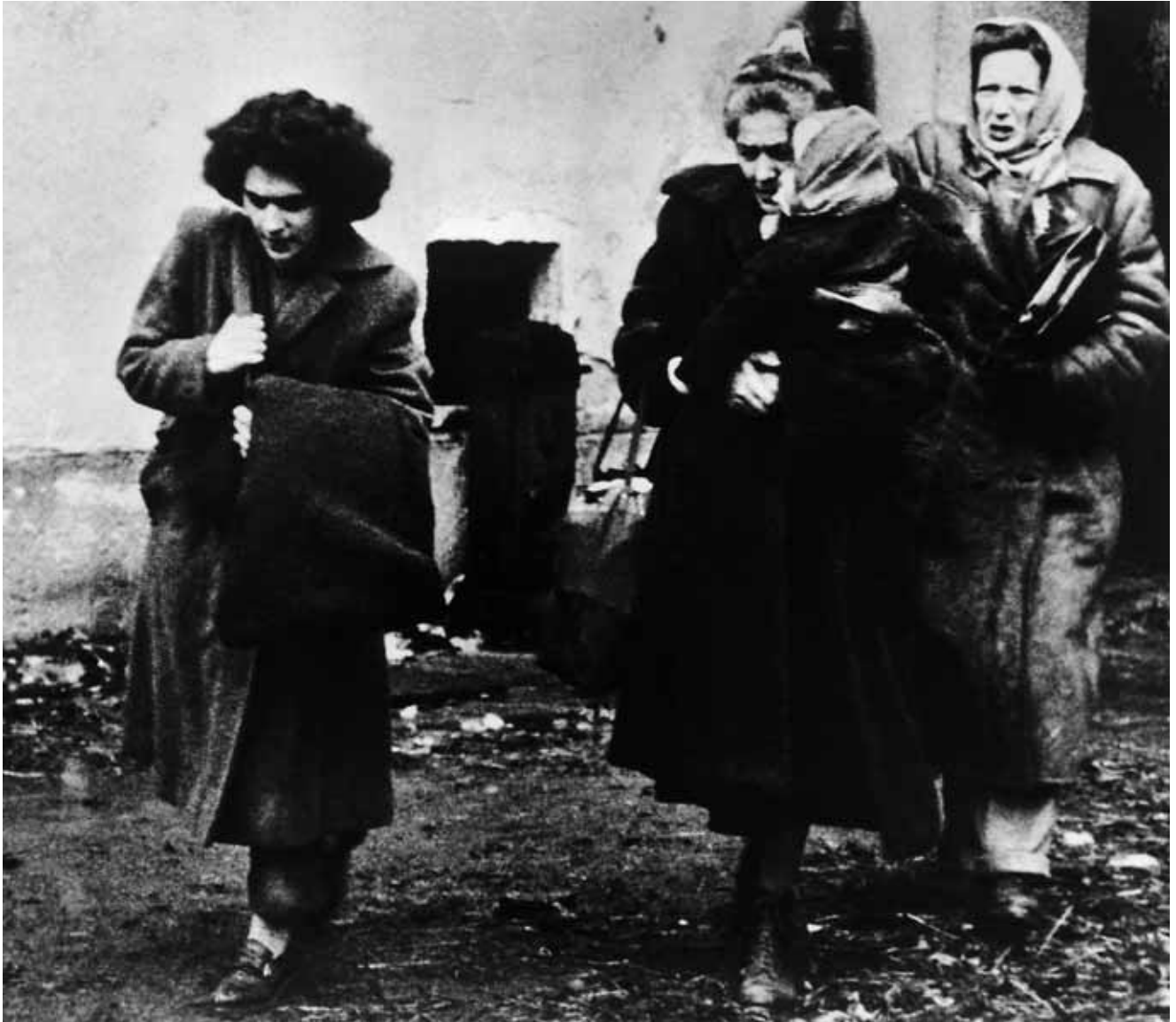
↑ NEUANKÖMMLINGE IM CAMP IN TRAIISKIRCHEN, 1956. INNERHALB VON DREI MONATEN FLOHEN 200.000 UNGARN NACH ÖSTERREICH UND JUGOSLAWIEN.

sogar Säuglinge in einem Raum. „Tränen von Győr“ und „die Hölle an der österreichischen-ungarischen Grenze“ schrieben die Zeitungen 1998 in Österreich, in Deutschland und in der Schweiz. 1 „Nochmals nach Ungarn?“, fragte ich einen jungen Asylbewerber aus dem Kosovo in der geschlossenen Gemeinschaftsunterkunft in Szombathely. „Ich werde sogar meine Enkel lehren, nie sollten sie Ungarns Erde betreten“, war seine Antwort.