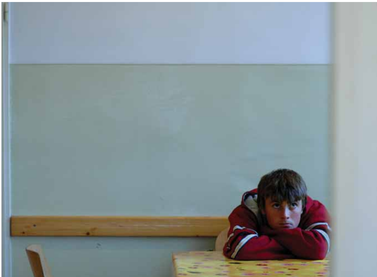
↑ MINDERJÄHRIGER IM ABSCHIEBELAGER AM FLUGHAFEN BUDAPEST

Die beiden Fälle von Inhaftierung von nach fachärztlicher Ansicht schwer traumatisierten Menschen (unter den weiter vorne beschriebenen Haftbedingungen) lassen bezweifeln, dass die europäischen Aufnahmerichtlinien von Ungarn eingehalten werden. Insbesondere Artikel 17, der ein besonderes Aufnahmesystem für Traumatisierte vorsieht, ist hier als verletzt anzusehen. 44