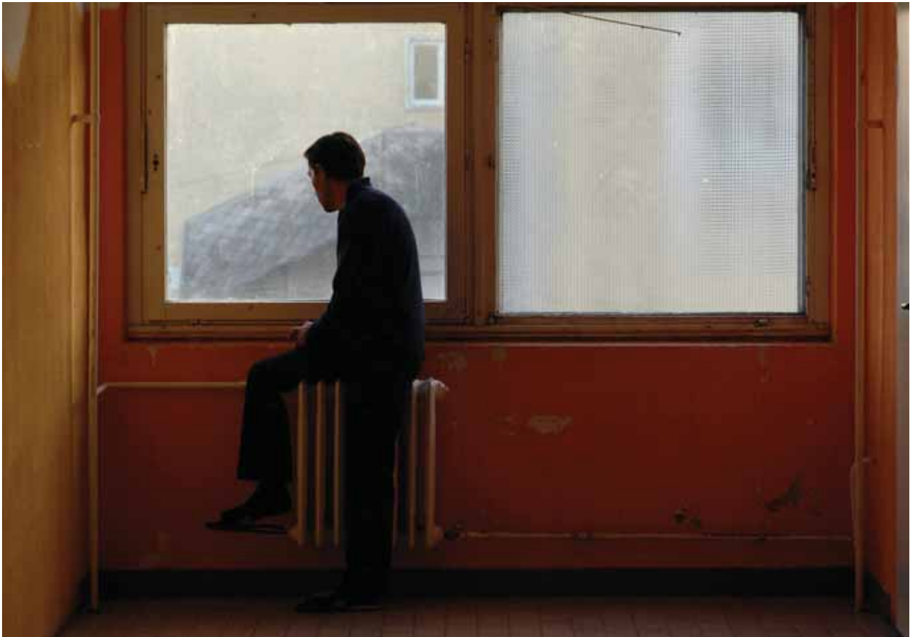
↑ WARTENDER FLÜCHTLING IM FLÜCHTLINGSLAGER DEBRECEN

in Budapest nicht zurückgreifen. Daher ist es für sie wie auch für viele andere Minderheiten de facto kaum möglich, Arbeit zu finden. Somit haben anerkannte Flüchtlinge zwar Zugang zum Arbeitsmarkt, nur ist es praktisch unmöglich, Arbeit zu finden. Wir haben im Rahmen unserer Recherche mit keinem einzigen (anerkannten) Flüchtling gesprochen, der Arbeit in Ungarn hat bzw. hatte, weder legal noch informell, etwa als Tagelöhner auf einer Baustelle.