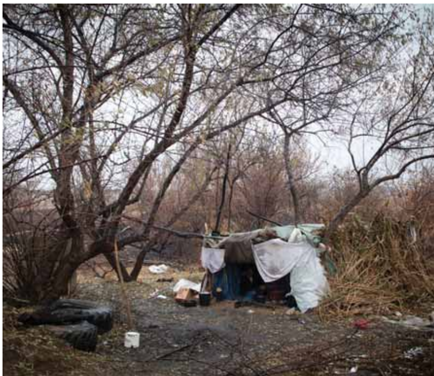
↑ FLÜCHTLINGSBLEIBE IN SERBIEN NAHE DER GRENZE ZU UNGARN

Nicht nur an der ukrainisch-ungarischen Grenze laufen Flüchtlinge Gefahr, zurückgeschoben zu werden. Zunehmend wird die serbisch-ungarische Grenze zum Brennpunkt von Refoulement. Im September 2011 fristeten in Subotica/Serbien, wenige Kilometer von der serbisch-ungarischen Grenze entfernt, hunderte Flüchtlinge aus unterschiedlichen Krisenregionen der Welt ihr Dasein - obdachlos auf einem Friedhof, denn dort gibt es immerhin Zugang zu Wasser. In einem Bericht ist von etwa 150 Personen die Rede, in anderen von hunderten, der Totengräber von Subotica schätzt sie gar auf 1000 Personen 62 . Sie kommen aus Pakistan, Afghanistan, Libyen, Tunesien. „Ich habe dreimal versucht, nach Ungarn zu gelangen“, sagt ein Libyer und fasst zusammen: „Ungarn? Großes Problem! Zwecklos zu sagen, dass man Asyl braucht. Sinnlos zu erklären, dass Krieg ist, dort wo wir herkommen oder dass wir verfolgt werden – das interessiert die ungarische Grenzpolizei nicht.“ 63 Anfang November 2011 brannte die serbische Polizei eine An-