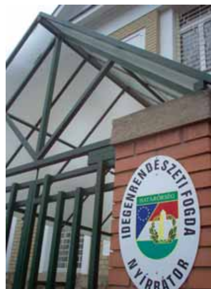
↑ HAFTZENTRUM IN NYÍRBÁTOR

Es gibt de facto kaum eine Möglichkeit, gegen die Inhaftierung erfolgreich Rechtsmittel einzulegen. Zwar ist gesetzlich festgelegt, dass die Inhaftierung unverzüglich zu beenden sei, wenn sich herausstellt, dass eine Abschiebung nicht durchführbar ist, dies ist jedoch in der Praxis so gut wie nie der Fall. Die Inhaftierung kann für maximal 72 Stunden ohne richterlichen Beschluss angeordnet werden, danach entscheidet ein Haft-