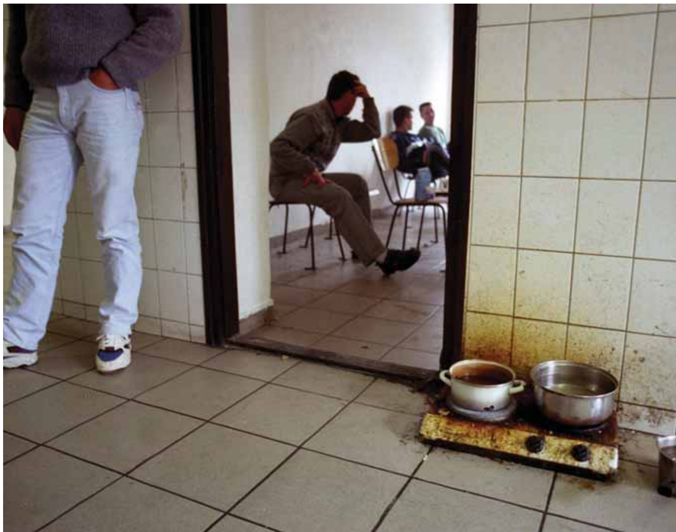
↑ HAFTLAGER IN GYÖR