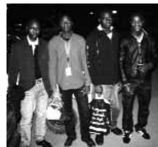
Zurück auf Los ziehen sie aber keine 4.000 Mäuse ein

und gehe zur Wendeltreppe, von der man auf die Türe zum Büro 118 schauen kann. Die Abgeschobenen gehen hinein, begleitet von malischen Polizisten. Die Übergabe hat schon stattgefunden, die französischen Polizisten werden mit der gleichen Maschine wieder nach Paris zurückkehren. Auch Keita geht in das Büro. Schließlich kommt er mit den drei Männern wieder heraus, ich folge ihnen in einigem Abstand. Keita hatte mir vorher gesagt, er werde mich nicht kennen, um seinen guten Kontakt zur Polizei nicht zu gefährden. Wir gehen über den Parkplatz zum Auto, dort stellt Keita mich den drei Männern vor. Er geht mit einem der Männer zurück zur Abfertigungshalle, diesmal zum Ankunftsbereich, es könne sein, so meint er, dass dort Familienangehörige auf den Mann warten. Ich komme mit den anderen beiden ins Gespräch. Beide sind in Paris auf dem Weg zur Arbeit aufgegriffen worden, und ohne gültiges Aufenthaltspapier gleich verhaftet worden. Sie haben jeweils mehrere Tage in einem Abschiebehafenzentrum verbracht, durften nicht mehr zu Hause vorbei, mitgebracht haben sie fast nichts. Der eine hat eine Plastiktüte dabei und ein paar Papiere, der andere hat gar nichts außer einer eleganten Lederjacke.