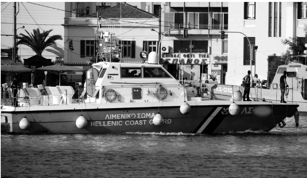
Boot der Küstenwache Lesbos mit Aufsatz zum Montieren eines Maschinengewehrs auf dem Vorschiff

Was dann geschieht, schildert Offizier N. so: »Normalerweise holen die Flüchtlinge ein Messer raus und schneiden das Boot kaputt. Wenn sie das aber nicht machen, dann ziehen meine Kollegen das Boot mit einem Seil zurück. Dann wehren sich die Leute manchmal, oder sie springen ins Wasser, um sich dann retten zu lassen. (...) Nachts ist es so, wenn wir sie kurz vor unserer Küste finden, und sie zerschneiden nicht ihr Boot, dann bringen wir sie manchmal zurück. Aber manchmal kommen sie auch tagsüber hier an. Und wenn sie dann ihr Boot nicht unbrauchbar machen – das ist dann ihr Fehler! – und