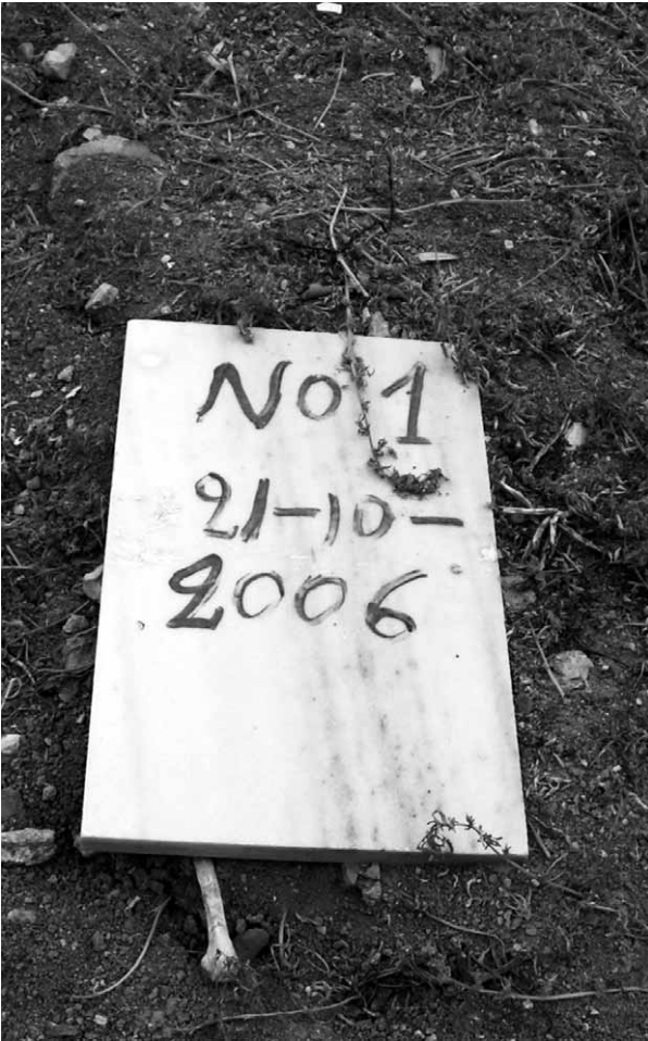
Namenloses Grab eines Flüchtlings in Mitilini/ Lesbos

Flüchtlinge werden in Anwesenheit von Beamten der Hafenspolizei und der lokalen Präfektur abgehalten. Die Präfektur übernimmt die Kosten der Beisetzung. Die meisten der toten Flüchtlinge waren Muslime, ein Begräbnis nach islamischen Ritual wurde ihnen in Mitilini jedoch verwehrt.