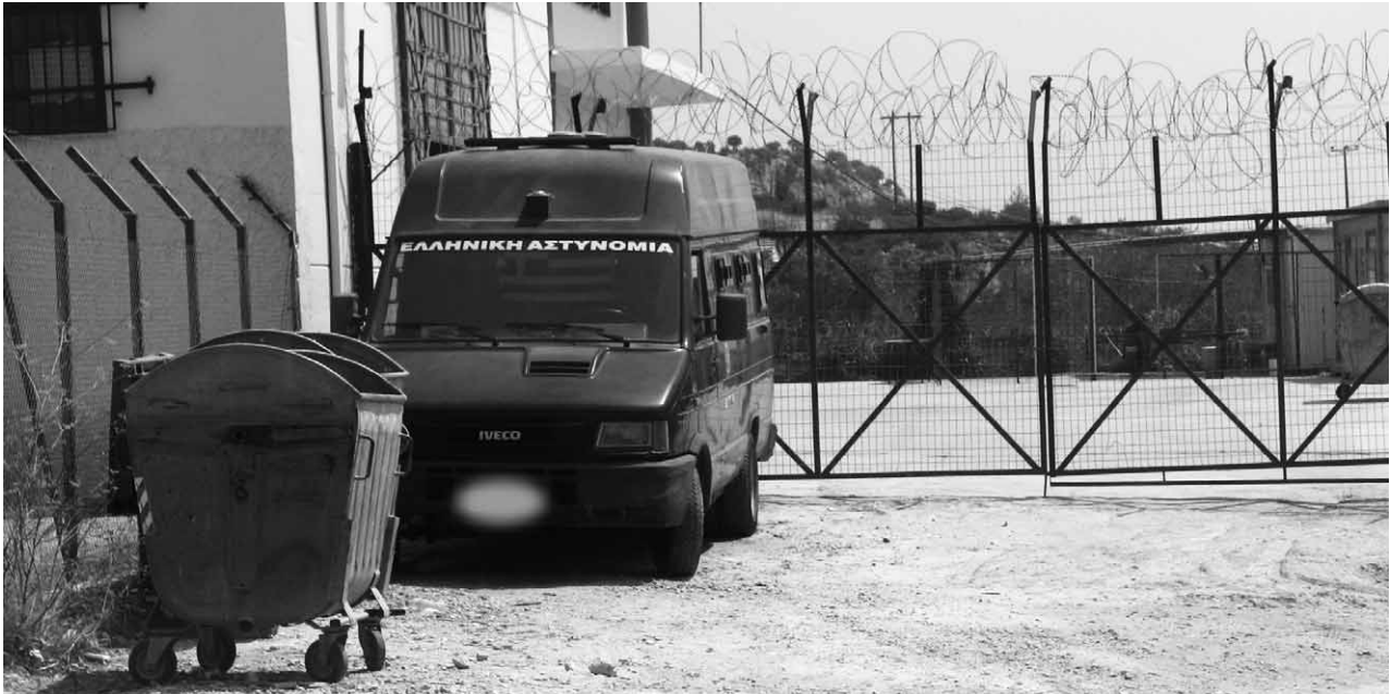
Lesbos: Eingangstor des Haftlagers