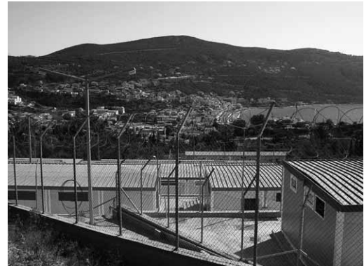
Samos: Neues Gefängnis

Wir sprachen mit einem Palästinenser aus dem Libanon, dem bei der Misshandlung durch die Küstenwache eine Rippe gebrochen worden war. Bis zum Zeitpunkt unseres Besuches war keine Krankenhausuntersuchung angeordnet worden, obwohl der Betroffene seit Wochen über Schmerzen und Blut im Speichel geklagt hatte. Erst am zweiten Besuchstag konnte unsere Delegation durchsetzen, dass der misshandelte Flüchtling ins Krankenhaus gebracht und dort – knapp zwei Monate nach der Misshandlung – endlich behandelt wurde. 32 Flüchtlinge aus Äthiopien und Algerien berichten ebenfalls von schweren Misshandlungen beim Aufgriff durch die Küstenwache.