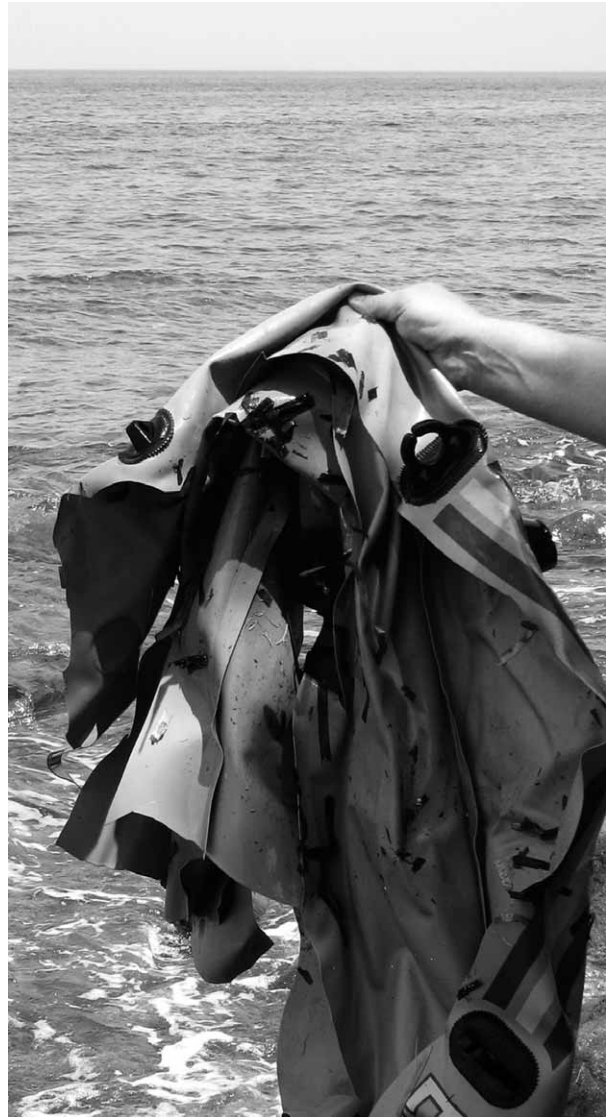
Lesbos: Wir finden ein zeretztes Schlauchboot. Was geschehen und was mit den Insassen passiert ist, ist eine ungeklärte Frage.

»Wir waren eine Gruppe von 22 Leuten. Die griechische Küstenwache kam, als wir mitten auf dem Meer waren. Man hat uns an Bord gezogen, so einen nach dem anderen. Zuerst einen 17-Jährigen. Der hieß M. F. Sie haben ihn gleich verprügelt. Die anderen haben Angst gekriegt und sind ins Wasser gesprungen. Dann haben sie uns rausgezogen und schon ging es los mit den Schlägen und Schüssen ... mich haben sie zusammengeschlagen, dabei ist eine Rippe gebrochen. Wir mussten uns flach hinlegen, dann sind sie auf uns draufgestiegen. Das ist alles auf dem Schiff der Küstenwache passiert. Kaum wa-