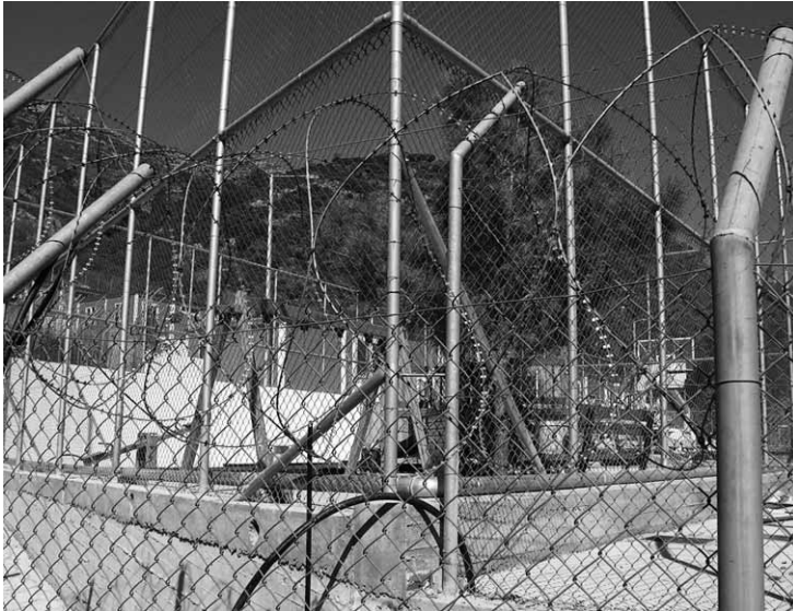
Samos: Kinderspielplatz im neuen Gefängnis