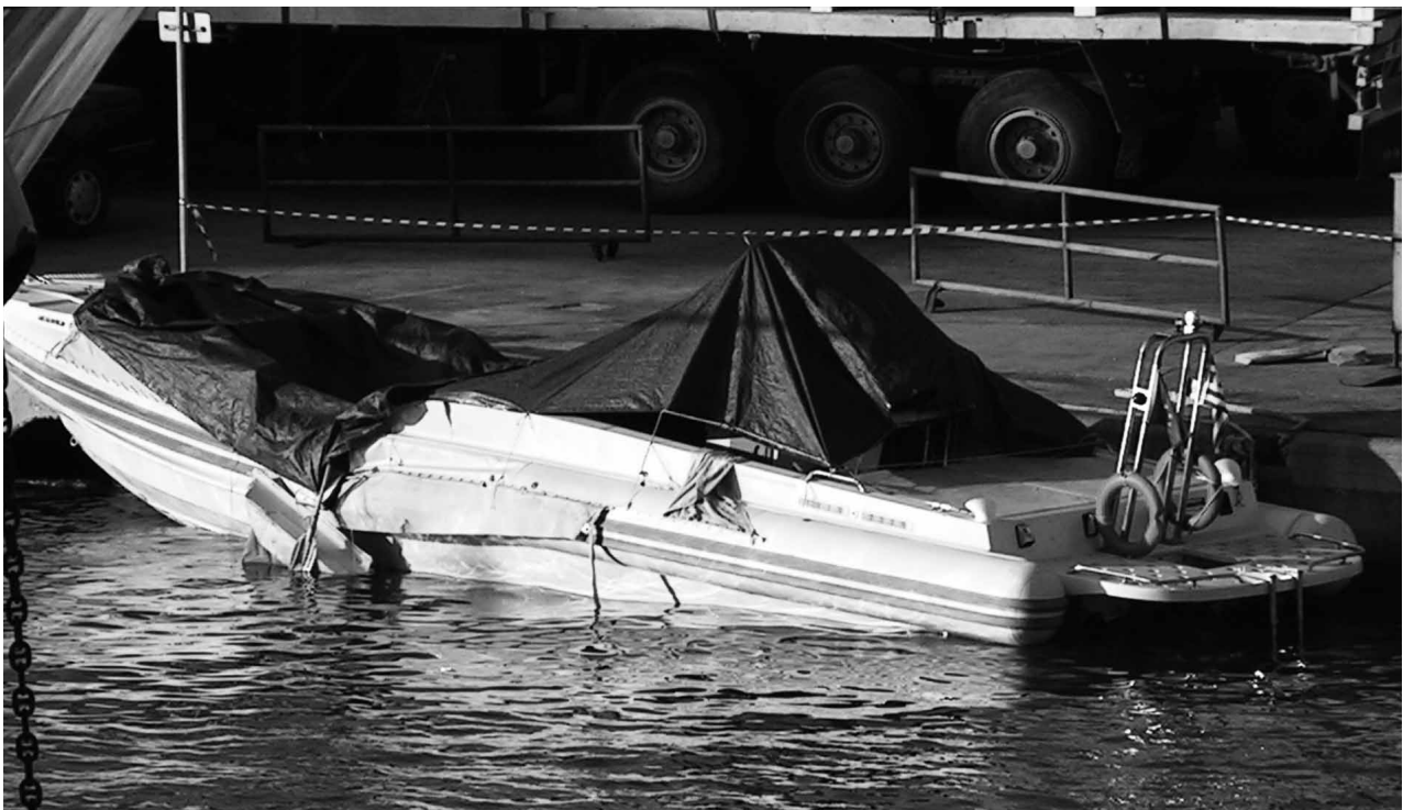
Chios: Vor der Küste wurde irrtümlich ein Boot von der Küstenwache beschossen.

Es handelte sich um drei griechische Staatsbürger. Die beiden Überlebenden des nächtlichen Zwischenfalls ge-