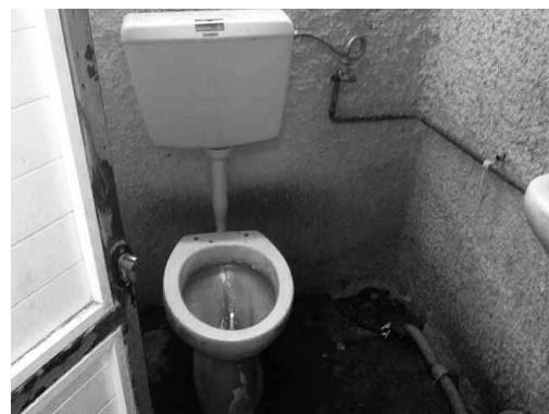
Haftlager Lesbos: Für jeweils 50 Flüchtlinge steht zum Zeitpunkt unseres Besuches nur eine einzige Toilette zur Verfügung.

Die afghanischen Minderjährigen wurden in zwei Gruppen am Tag unseres Besuches am Freitag, den 20. Juli 2007 und am darauffolgenden Samstag, den 21. Juli 2007 entlassen. An beiden Entlassungstagen musste außerhalb des Lagers eine Erstverpflegung für sie organisiert werden. Die erste Gruppe war gezwungen, eine Nacht im Hafen von Mitilini verbringen, weil es keine kostengünstige Fährverbindung nach Athen gab. Sie erhielt keinerlei Informationen über Asylantragstellung, Unterkunfts- oder andere Überlebensebenen. Auf ihren Entlassungspapieren (ein Informationspapier in griechischer Sprache mit der Aufforderung das Land innerhalb von 30 Tagen zu verlassen – auf der zweiten Seite war die Abschiebungsanordnung angeheftet) wurden die minderjährigen Kindern offenkundig wahllos irgendeinem der afghanischen Erwachsenen mit dem Vermerk: »Bruder« oder »Cousin« zugeordnet und dessen Bild aufgeklebt. Einige offensichtlich Minderjährige hat man in den Papieren ohne nachvollziehbare Anhaltspunkte schlicht zu Volljährigen erklärt. Unsere Delegation hat diese Kinder