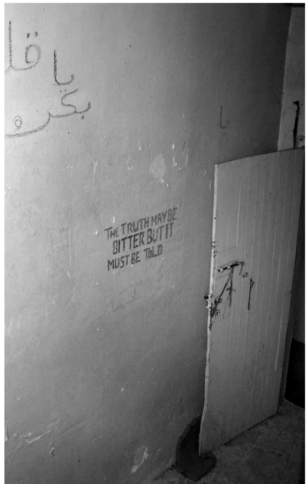
Wandinschrift aus dem früheren Haftlager auf Lesbos

Erforderlich ist deshalb der Aufbau eines fairen Asylsystems in Griechenland und in der Europäischen Union. Dieses muss auf den Menschenrechten basieren und dem Prinzip der absoluten Beachtung des Asylrechts, wie es die EU-Staats- und Regierungschefs in Tampere im Oktober 1999 bekundeten. Ansonsten setzt Europa die Errungenschaften der Menschenrechtsentwicklung, auf die der Kontinent so stolz ist, an seinen Außengrenzen aufs Spiel.