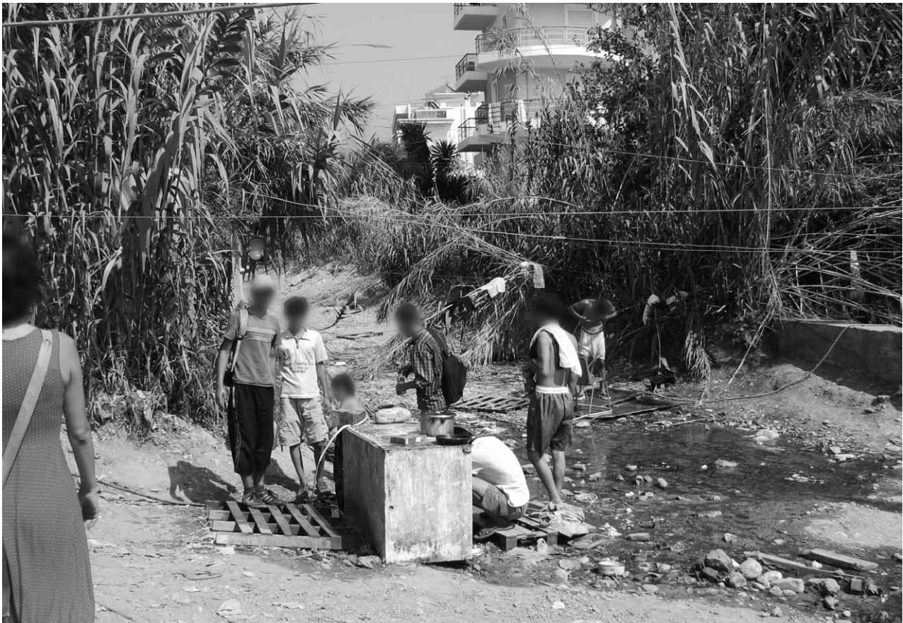
Patras: obdachlose Flüchtlinge an einem Fluss, der als einzige Wasserstelle dient

Im Lager begegnen uns die Menschen zuerst mit Misstrauen. Sie wirken verstört und sind offenkundig auf Unterstützung angewiesen. Im Gespräch müssen wir feststellen, dass die Flüchtlinge über ihre Lage und das europäische Asylrecht, insbesondere das Dublin II-Verfahren, vollkommen uninformiert sind. In der Gruppe der Flüchtlinge waren viele, die auch nach den restriktiven Regeln des europäischen Verteilungssystems gute Chancen auf einen legalen Aufenthalt oder ein Asylverfahren in einem anderen europäischen Land gehabt hätten.