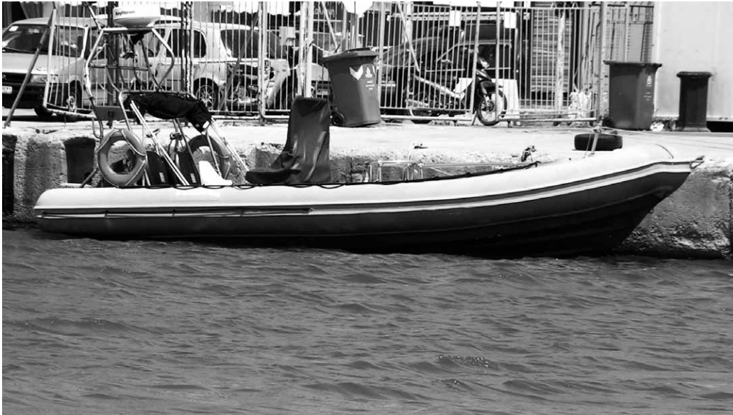
Spezialboot der Küstenwache ohne Kennzeichen und Flagge

ben eine andere Darstellung der Geschehnisse: Sie hätten sich auf einer nächtlichen Spritztour befunden, als plötzlich das Boot der Küstenwache auf sie zugekommen sei. »Wir haben sofort gestoppt – unser Bootsführer hat sich im Scheinwerferlicht hingestellt und die Hände über den Kopf gehoben«, sagten die Männer in einem Bericht des staatlichen Fernsehens. Dann seien auch schon die ersten Schüsse gefallen. Der Bericht der amtlichen Leichenschau stützt die Darstellung der Überlebenden: Der Getötete wies Schussverletzungen im vorderen Bauchbereich auf – außerdem fehlten ihm zwei Finger. Das Boot – es liegt bis zum Abschluss der Untersuchungen im Hafen von Chios – wurde durch den schweren Beschuss nahezu in zwei Hälften geteilt. Entgegen den Angaben der Küstenwache, es habe »keinerlei Hoheitszeichen getragen«, ist die griechische Flagge am Heck deutlich zu erkennen.