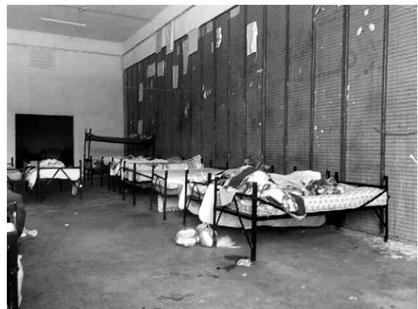
Lesbos: Schlafsaal im Haftlager