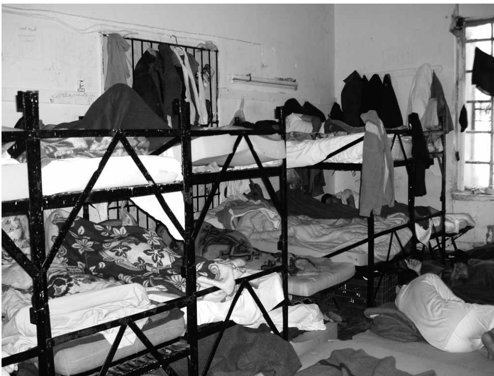
Samos: Schlafsaal in der Haftanstalt

Diese Einschätzung wird von der Delegation des Europaparlaments geteilt: »Als Arznei für Kranke wird hauptsächlich Aspirin verabreicht, da in der Einrichtung kaum eine medizinische Ausstattung vorhanden ist. Weil es an Wachpersonal fehlt, können Menschen nicht ins Krankenhaus gebracht werden. Und wenn es möglich wäre, den Transport ordnungsgemäß zu organisieren, hätte das Krankenhaus nicht genügend Kapazität für die Behandlung.« 31