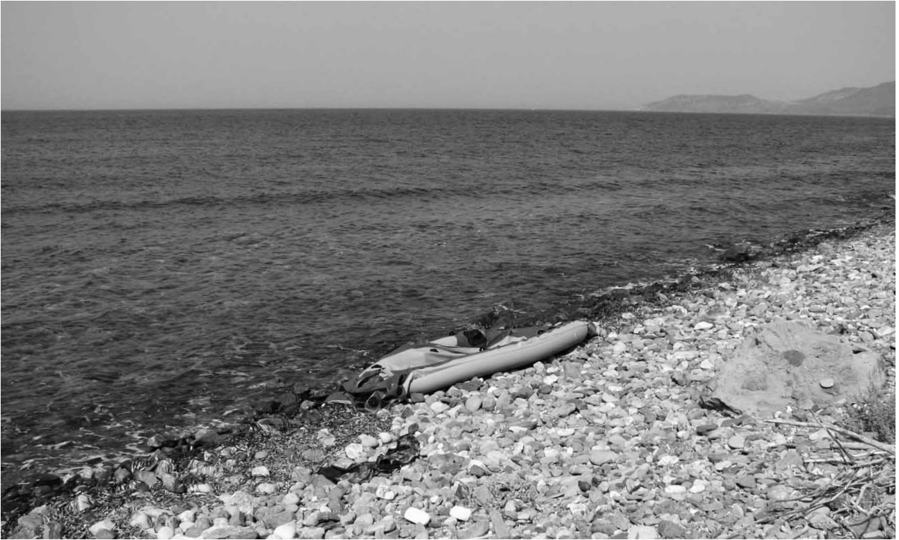
Nordküste von Lesbos: angetriebenes Schlauchboot