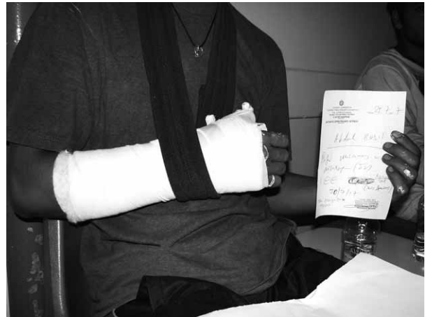
Patras: Flüchtling nach schweren Misshandlungen nach der Behandlung im Krankenhaus.