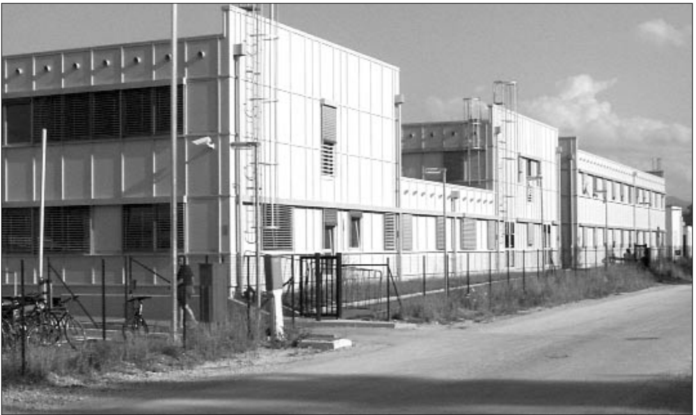
Asylunterkunft, Ljubljana, Juli 2005