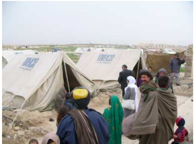
Lager auf dem Helmand-Baustofflagergrundstück in Mazar-e-Sharif

Das Gelände ist ohne Wasser, ohne Strom, ohne Schatten. Wasser muss jenseits der Straße von einer Schule gekauft werden. Die Männer versuchen, sich als Tagelöhner durchzuschlagen, doch nicht alle bekommen täglich Arbeit. In der Vergangenheit habe man eine Winterhilfe erhalten, diese sei jedoch ausgelaufen.