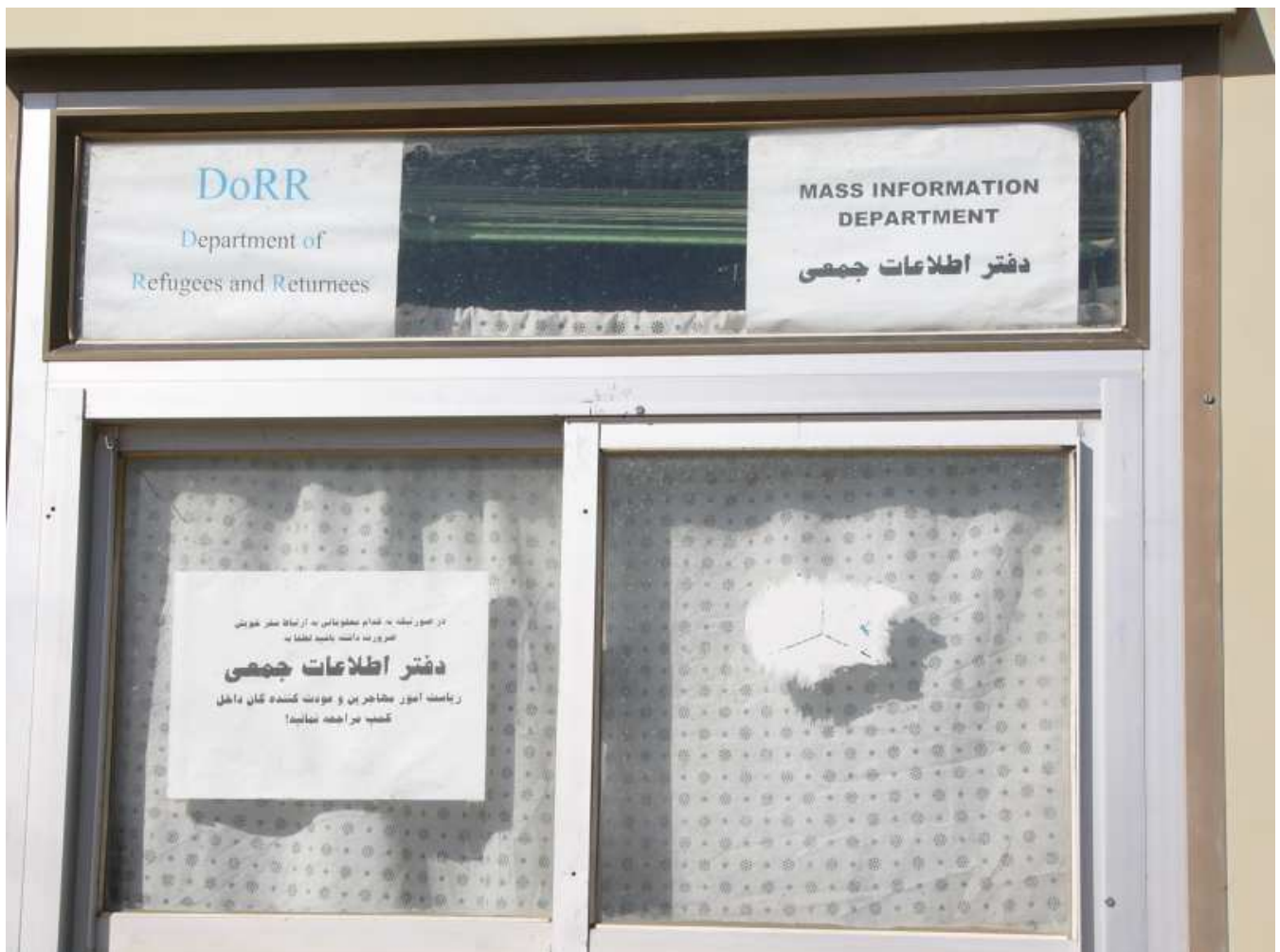
Registrierungscamp in Herat

Der anwesende Vertreter des UNHCR wird von den Flüchtlingen verbal angegriffen wegen der Kriterien, nach denen Registrierungen vorgenommen würden. Registriert seien 2640 Familien, tatsächlich seien es doppelt so viele. In diesem Lager gebe es 20 000 Flüchtlinge oder noch mehr. Seit Jahren sollten sie das Camp verlassen. Dafür brauchen sie Land und was dazu gehöre. Das gebe es aber nicht. Jetzt sei man eine große Gruppe von Bettlern, man leiste denen Nachbarschaftshilfe, die nicht betteln könnten. Einige