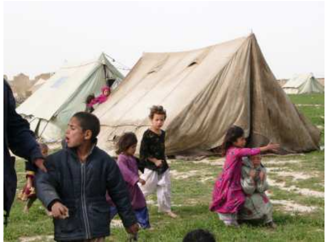
Lager auf dem Helmand-Baustofflagergrundstück in Mazar-e-Sharif

Hinblick auf den Anstieg der Mieten. Das Problem wird noch verstärkt durch die Bevölkerungsexplosion. So lebt in der Provinz Nangahar mit der Hauptstadt Jalalabad heute das 5 bis 10-fache der Bevölkerung, verglichen mit der Zeit vor dem Kriege. Entsprechendes gilt für die übrigen Ballungsgebiete.