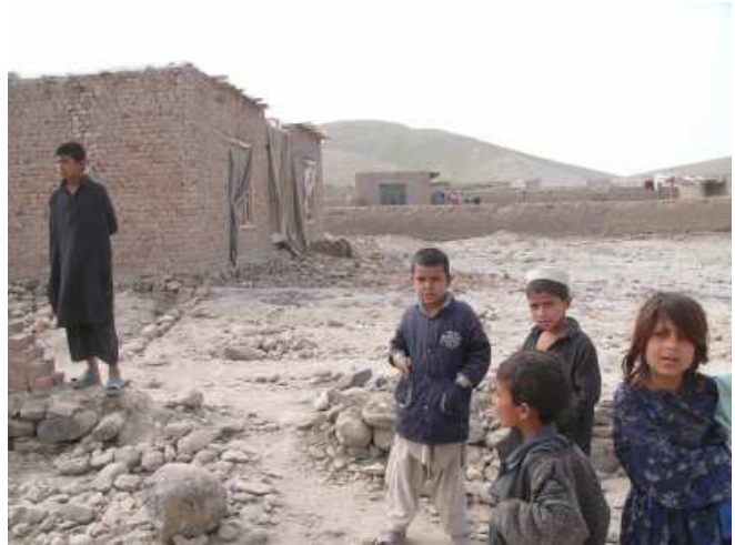
Shaikh-Meri-Camp in Jalalabad

und Schreiben beibrächten. Sie selbst lebten in einem anderen Lager. Sie seien ausgebildete Lehrerinnen. Auf die Frage, warum die Kinder keinen Unterricht erhielten: Für den Unterricht der Kinder fehle ein Raum. Es gebe nicht einmal eine große Plane, unter der unterrichtet werden könne, ganz zu schweigen von Schulbüchern, Heften und Schreibgerät.