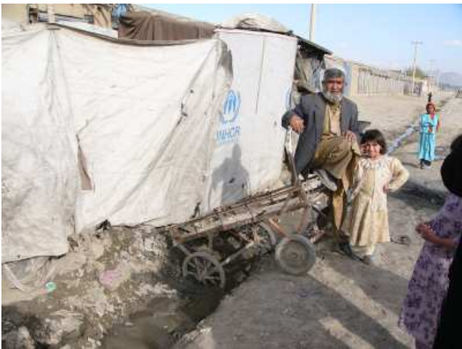
Rückkehrercamp in der Taimani-Straße in Kabul, Rückkehrer mit Tochter

Der unbestrittene Besitz von Grundeigentum ist unabdingbar Voraussetzung dafür, dass UNHCR Material zur Errichtung einer Unterkunft, bestehend aus zwei Zimmern und einem Flur, zuteilt. Immer wieder hat die Regierung angekündigt, Rückkehrern Land zuzuweisen. In 19 Provinzen ist dafür Land ausgewiesen (teils umstritten). In Gardez ist sogar eine Zuteilung erfolgt; es wurden Häuser errichtet, aber jetzt macht das Verteidigungsministerium Ansprüche geltend. Es gibt bis jetzt keine Kriterienfestlegung, wem Land zugewiesen werden soll. Vor allem aber wäre es mit Landzuweisung nicht getan. Erforderlich ist Infrastruktur wie Trink- und Abwasser- sowie Gesundheitsversorgung, Arbeitsplätze, Schulen: Für all dies mangelt es an Geld.