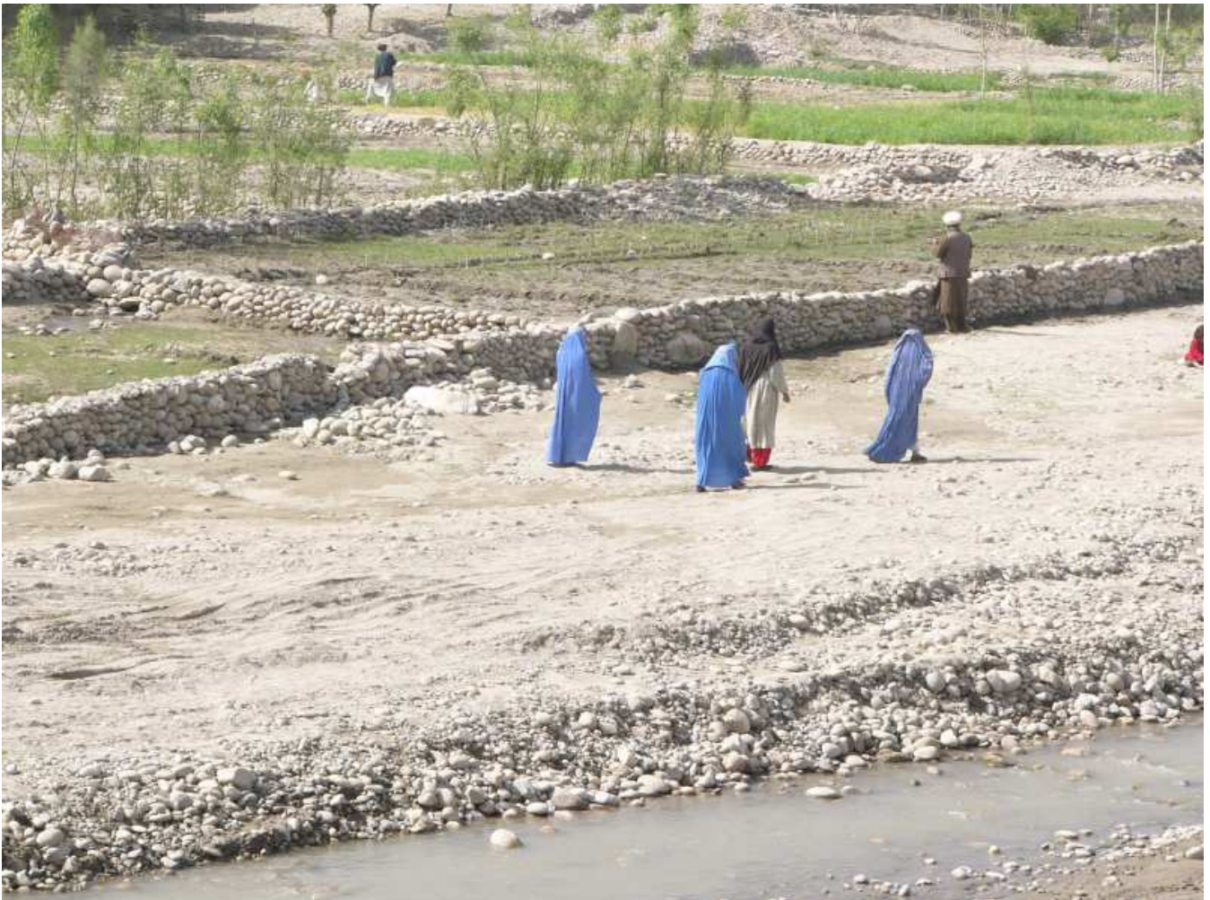
Am Rande der Straße nach Jalalabad