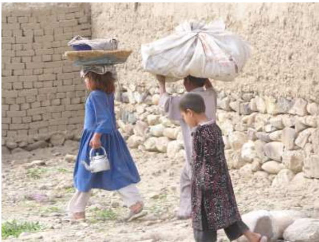
Shaik-Meri-Camp in Jalalabad

Willen der Familie. Dazu gehört zwar auch, das Haar zu bedecken oder gar die Burka zu tragen, wie viele Männer es von weiblichen Familienmitgliedern fordern. Darin drückt sich jedoch nur äußerlich die patriarchalische Prägung der Gesellschaft aus, die es Frauen nur schwer oder gar nicht ermöglicht, ein Leben nach eigenen Vorstellungen zu führen. Frauen, die in der deutschen Gesellschaft gelebt haben und integriert waren, erleben bei zwangsweiser Rückkehr die Konfrontation mit einer ihnen fremd gewordenen Welt. Ihnen dürfte es schwer fallen, afghanischen Normen zu genügen. Viele Frauen werden die Kluft zwischen beiden Gesellschaftsordnungen nur mit großen Schwierigkeiten ohne Schaden überwinden können.