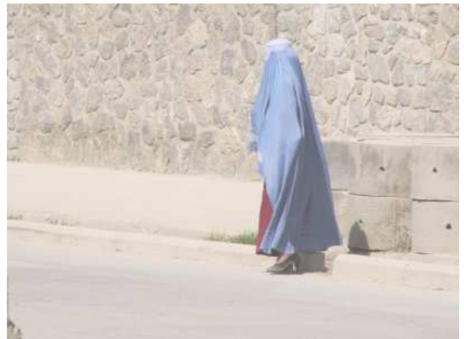
Hauptstraße in Kabul

Stationen der Reise waren Kabul, Mazar-e-Sharif, Ghazni, Herat und Jalalabad. Die Reisen nach Mazar-e-Sharif und Herat erfolgten entweder mit der afghanischen Fluggesellschaft Ariana oder mit kleinen Passagierflugzeugen von PacTec. Der Rückflug von Mazar-e-Sharif nach Kabul wurde wegen Sturms kurzfristig storniert. Die Rückreise nach Kabul musste deshalb wie die Fahrten in die anderen Städte mit Pkw erfolgen. Die Fahrten erfolgten in der Regel tagsüber. Angriffe auf Pkws des Nachts kommen in allen Regionen vor. Auf eine Reise in den Süden und insbesondere nach Kandahar wurde aus Sicherheitsgründen verzichtet.