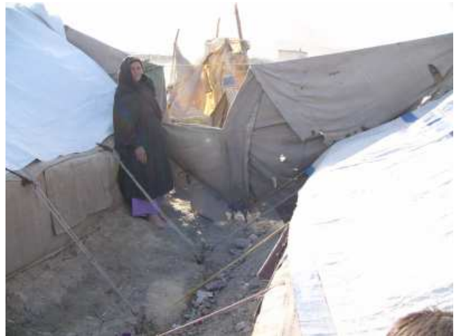
Zeltcamp gegenüber der Taimani-Straße in Kabul

nicht, wie sie das Geld zurückzahlen solle. Ihr Schwager, der mit seiner Familie nebenan haust, verkauft getrocknetes Obst auf einem Karren als Straßenhändler. Im letzten Winter habe er nichts verdienen können, weil es zu viel Schnee gegeben habe. Aber auch die Regierung wolle die Straßenhändler nicht und jage sie von den Straßen; wiederholt habe ihm die Polizei schon seinen Karren umgestoßen. Die Rückkehrer aus Pakistan leben unter diesen Bedingungen seit mehr als eineinhalb Jahren. Die Straße soll demnächst geräumt werden. Die Ladenbesitzer wollen die Läden wieder in Besitz nehmen. Die Bewohner wissen nicht, was mit ihnen geschehen wird.