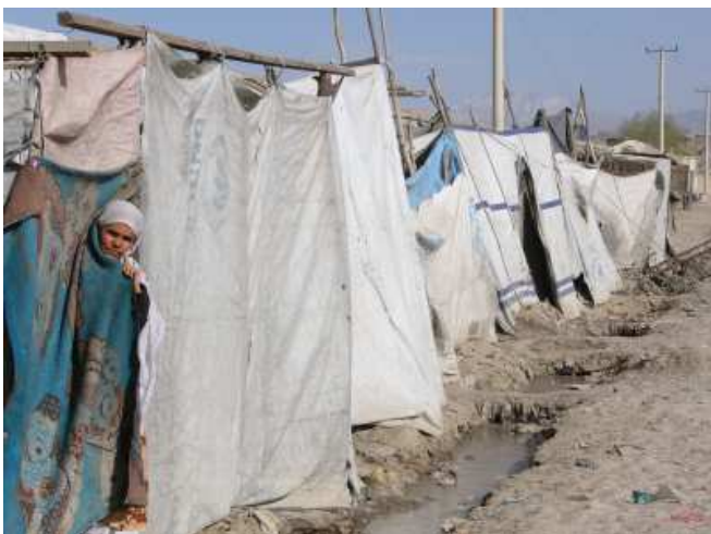
Rückkehrercamp in der Taimani-Straße in Kabul