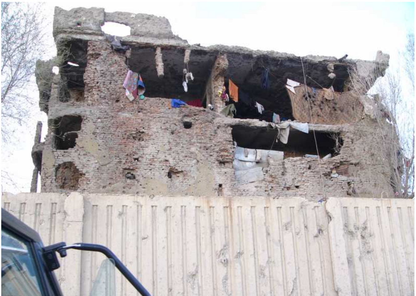
Wohnen in den Ruinen in Ashraf, Stadtteil von Kabul

Eine Unterkunft in Zelten in von Hilfsorganisationen betreuten Lagern kommt schon deshalb nicht in Betracht, weil die Hilfsorganisationen sich in diesem Zusammenhang allenfalls um Rückkehrer aus Pakistan und Iran kümmern, wenn überhaupt Hilfe geleistet wird. Vielfach scheidet selbst das aus. Es ist erklärte Politik des UNHCR, keine Zeltlager mehr entstehen zu lassen. Bestehende Rückkehrerlager mit auch nach afghanischen Verhältnissen zumutbarem Wohnraum gibt es nicht (siehe oben Teil E., S. 14).