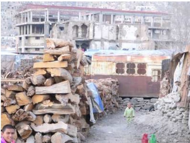
In Ashraf, Stadtteil von Kabul, zwischen den Ruinen

Für allein stehende Minderjährige ohne Rückkehrmöglichkeit in die Familie stehen Betreuungsmöglichkeiten nicht zur Verfügung. Afghanistan hat zwar bereits im Jahr 2002 die Kinderrechtskonvention unterzeichnet und gesetzliche Maßnahmen zum Schutz der Kinder eingeleitet. In der Realität kann jedoch von ihrem Schutz nicht die Rede sein. Es gibt zwar offiziell Waisenhäuser, die vom Staat oder vom afghanischen Roten Halbmond unterhalten werden. Sie befinden sich aber nach einhelliger Auffassung in einem unerträglichen Zustand. Im Übrigen werden Jungen ab 15 Jahren dort nicht mehr aufgenommen. Ihnen droht also das Schicksal eines obdachlosen Straßenkindes, mit all den Gefahren für Leib und Leben, die daraus resultieren – für Minderjährige, die seit Jahren den harten Überlebensbedingungen in Afghanistan entwöhnt sind, nach übereinstimmender Meinung sämtlicher Gesprächspartner im Übrigen ein kaum zu verkraftender Kulturschock. Ein von der UN gefördertes Straßenkinderprojekt betreut betroffene Kinder nur tagsüber und entlässt sie am Nachmittag wieder auf die Straße.