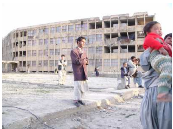
Wohnen in den zerschossenen Blocks des Verteidigungsministeriums in der Dar-ul-Aman-Straße in Kabul

Die Besetzung der Richterstellen im Land ist nicht geeignet, bei der Öffentlichkeit Vertrauen in die Justiz zu schaffen. Die Mitarbeiterin einer Organisation in Mazar-e-Sharif, die auch Rechtshilfe leistet, schildert den Vorsitzenden des Zivilgerichtes der Provinz, in der ganz überwiegend nur »dari« gesprochen wird, so: »Er stammt aus Kandahar, spricht nur pashtu, ist älter, sieht schlecht und hört nichts und ist ein Mullah, was in diesem Fall bedeutet: ungebildet.«